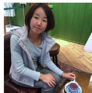
シナモンティーのシーンを再現した展示

展開されています。しかも、神戸別品博覧会は一過性のイベントにとどまらず、期間中はもちろん期間終了後も、新しい商品が次々と発信される予定です。ドラマの展示は放映の進行をたどるように内容が変わっていくそうですので、早めに訪れた方がいいですよ！